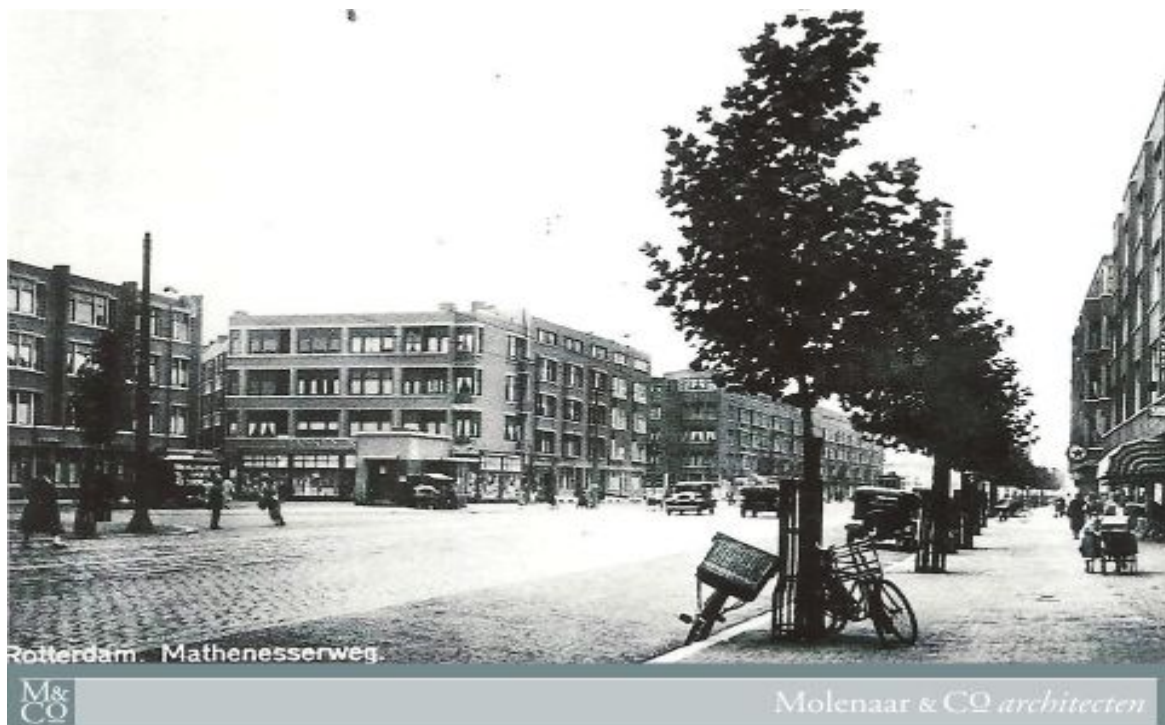
Figuur 1: De 2 huizenblokken die zijn verdwenen. Ter hoogte van de auto bevindt zich de ingang naar de Nanningstraat.

Op de voorgrond het transformatiehuysje met bloemenkiosk en wachtruimte.