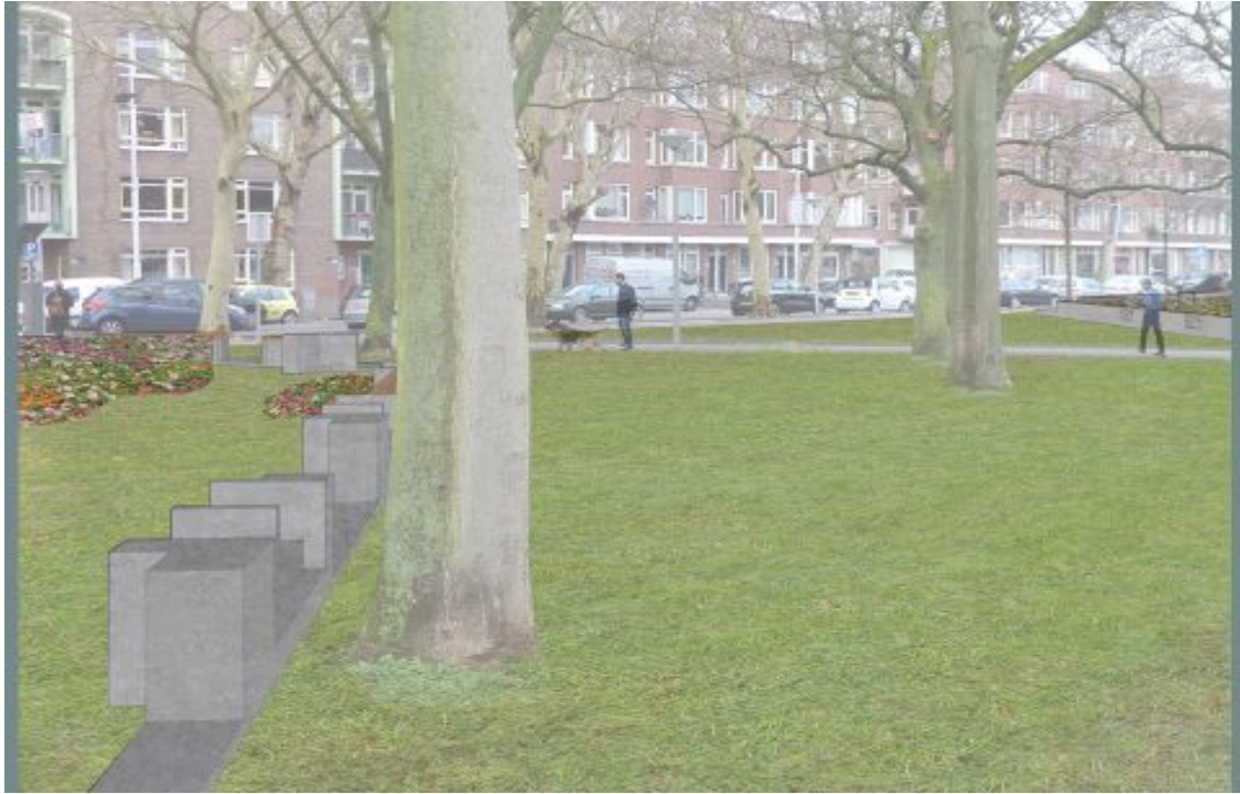
Figuur 5: De Nanningstraat, die uitkwam op de Mathenesserweg.