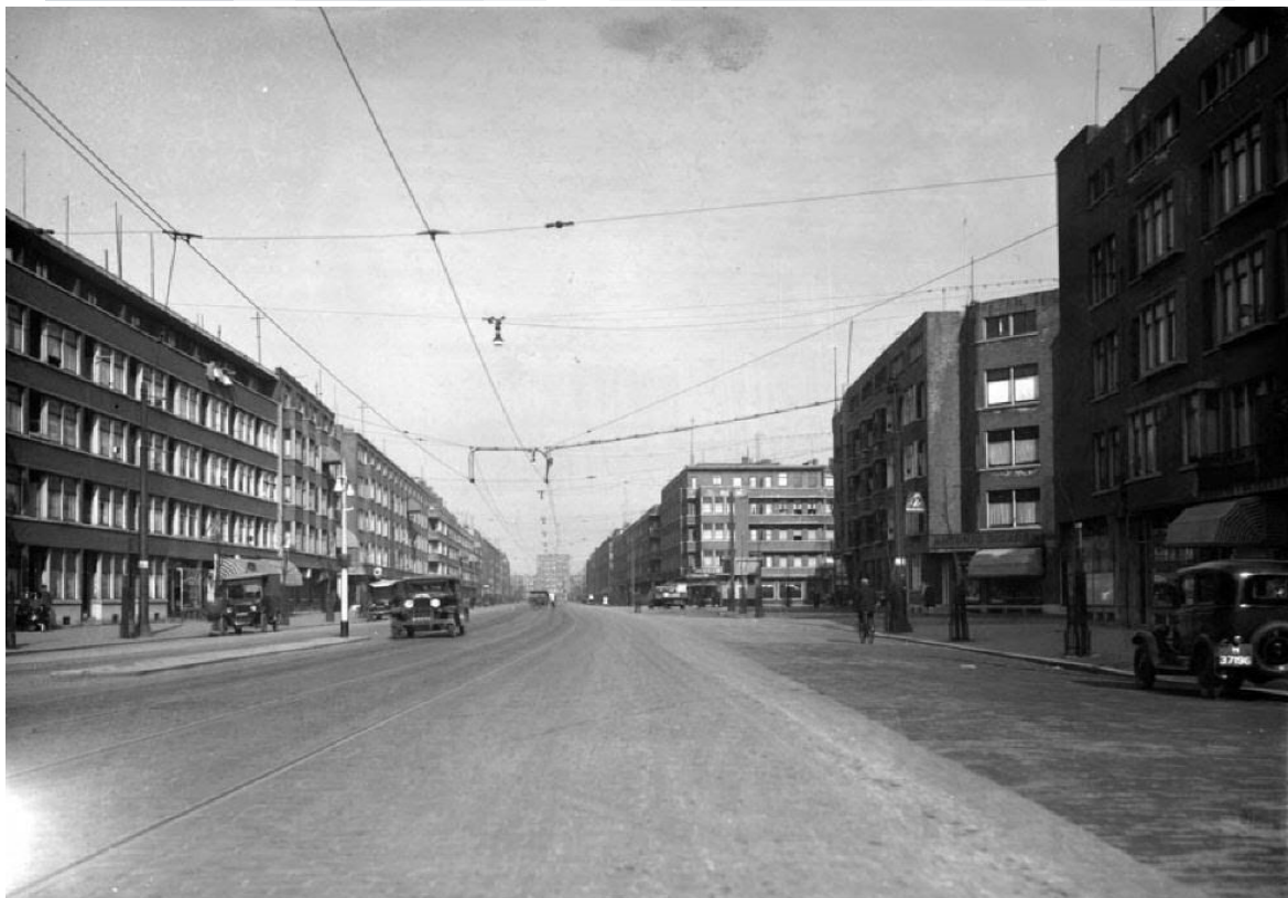
Figuur 4: Dit is ongeveer dezelfde plek als bij figuur 3 maar wel 90 jaar eerder. Achter de auto rechts had Frank van Erkel zijn winkel op 174A (met uitgeklapte markies) en boven zijn woning. Op de tweede verdieping woonde Frans Boxem, die omkwam bij het bombardement. Drie winkels verder zie je de hoek van de Nanningstraat.